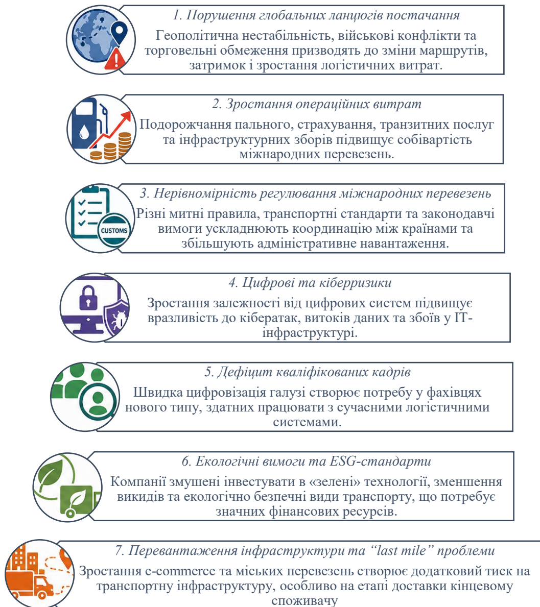
Рис. 1. Основні виклики та проблеми міжнародних транспортних компаній

Використання Big Data та штучного інтелекту суттєво підвищує якість управлінських рішень у транспортній логістиці. Аналітичні системи дозволяють: