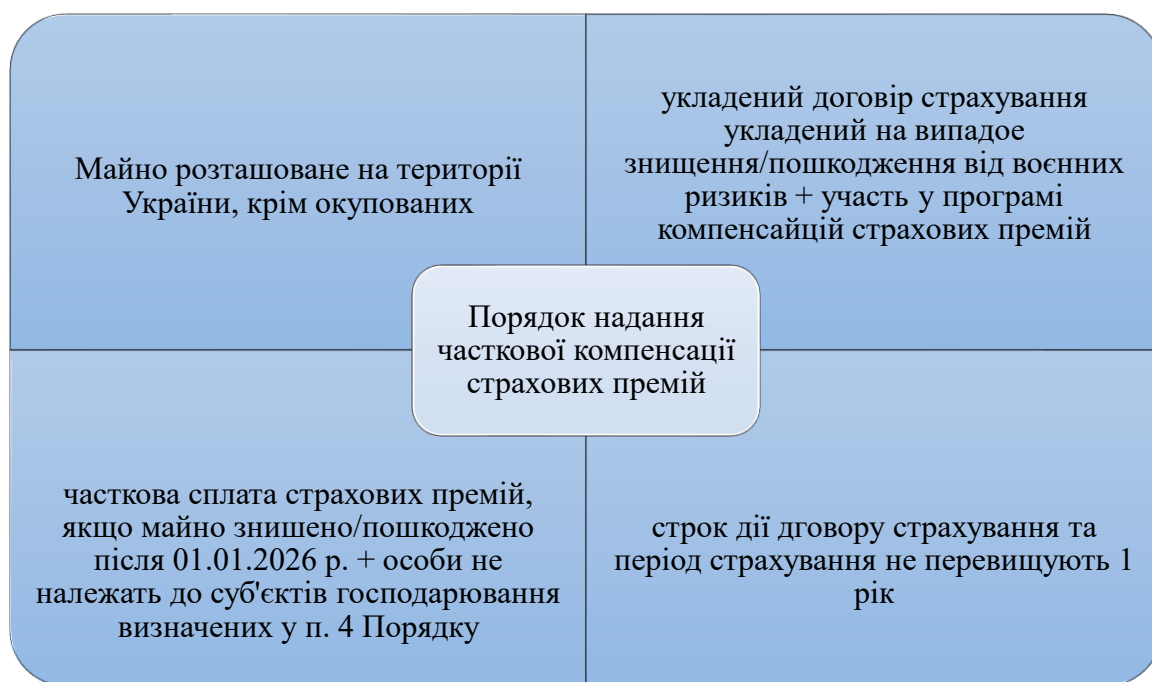
Рис. 2 Порядок надання часткової компенсації страхових премій за договорами страхування від воєнних ризиків

Хоча, з іншої сторони, якщо суб'єкт господарювання не бере участі у програмі з відшкодування, він має право, у випадку знищення/пошкодження майна спричиненими війною, бути включеним до Міжнародного реєстру збитків та отримати репарації. Однак, постає логічне і справедливе питання: «коли буде відшкодування?» Тому необхідно зробити розрахунок сум, які необхідно сплатити за участь у програмі та вартості всього майна, враховуючи те, що максимальна сума сукупно не може перевищувати 10 млн. гривень протягом усього строку дії програми з компенсації за пошкодження/знищення майна.